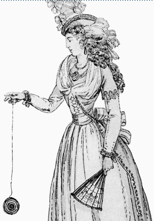
Ilustración en una revista francesa de modas (1791) de una mujer jugando con una temprana versión del yo-yo.

Una pintura de 1769 muestra a Luis XVII, de solo cuatro años, jugando con un yo-yo, al que en ese momento se llamaba l'emigrette, es decir, "el emigrante". Esta denominación hacía referencia a quienes usaban ese objeto como único juguete: los hijos de los nobles que emigraban a otros países debido a la Revolución Francesa. En el siglo XVIII, los soldados franceses y hasta el mismo Napoleón usaban el yo-yo como un objeto antiestrés. Sin embargo, el yo-yo permaneció en relativa oscuridad hasta fines de 1920, cuando se empezó a producir en una fábrica en Estados Unidos y, rápidamente, creció en popularidad.