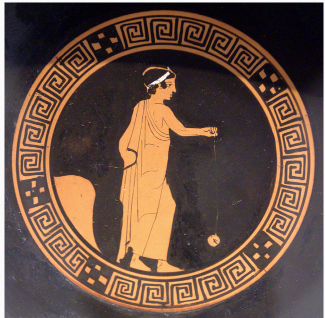
Muchacho jugando con un yoyo de terracota, en una copa griega del siglo 440 a. C.

Más allá de este movimiento típico, con el tiempo se fueron inventando distintos trucos para hacer con el yoyo. El más conocido es “el dormilón”, que es la base de casi todos los demás, y consiste en mantener el yoyo girando, mientras permanece en el extremo de su cuerda desenrollada. Otros trucos conocidos son: “pasear el perro”, “el ascensor”, “la vuelta al mundo”, o el más complejo “acunar el bebé”. No se conoce con exactitud el origen del yoyo, aunque se estima que pudo tener un antecedente en la antigua Grecia. En una copa ateniense del siglo V a. C., aparece un joven que sostiene un objeto esférico que pende de un hilo, en una actitud que recuerda a la del moderno juego del yoyo. Sin embargo, no se conocen a ciencia cierta las características concretas de aquel objeto ni su utilidad.