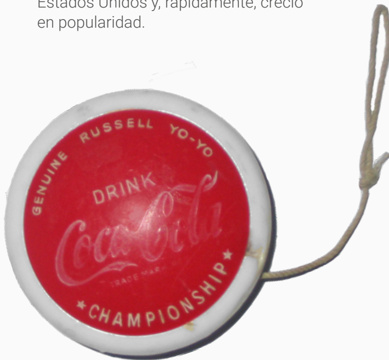
Yo-yo Russell.

En Argentina, durante la década de 1970, se creó un gran furor alrededor del yo-yo, con marcas como Bronco y Russell. A comienzos de los años ochenta, la empresa Coca-Cola lanzó un yo-yo del rojo característico de la marca.