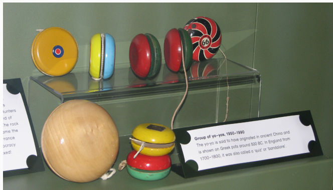
Yo-yos de diferentes tamaños y decoraciones.

El yoyo es un juguete formado por un disco de madera, de plástico o de otros materiales, con una ranura profunda en el centro de la cual se enrolla un cordón. Anudado a un dedo, este cordón lo hace subir y bajar alternadamente. El disco se maneja mediante sacudidas hacia arriba y hacia abajo.