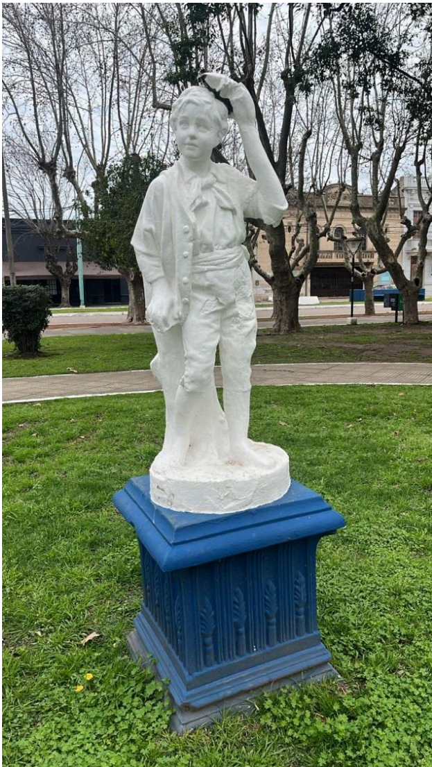
Estatua del Niño Inmigrante. Monumento emplazado en 1921, plaza Rivadavia, Los Toldos, provincia de Buenos Aires.

La mencionada resolución se firmó durante la presidencia de Juan Domingo Perón con el propósito de reconocer los aportes históricos y culturales que las y los inmigrantes tuvieron y tienen en Argentina. Esta efeméride remite a 1812, cuando el Primer Triunvirato firmó un decreto mediante el cual fomentó la acogida en el país “(...) a los individuos de todas las naciones y a sus familias que deseen fijar su domicilio en el territorio (...)”.