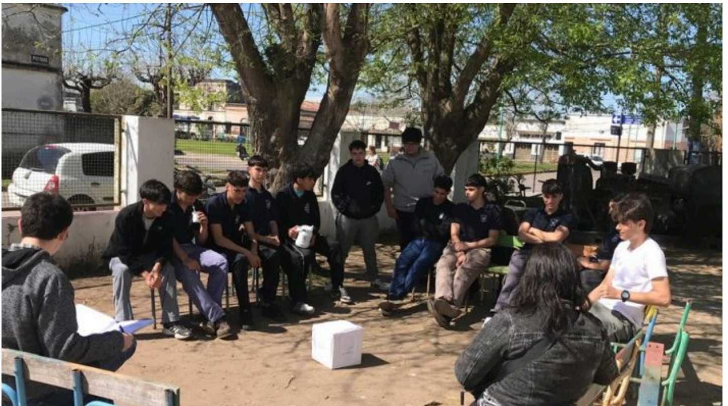
Imagen de portada: Estudiantes de secundaria de General Belgrano.

Autoría: Dirección de Psicología Comunitaria y Pedagogía Social, Subsecretaría de Educación, DGCyE