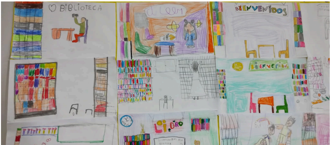
Escuela Primaria N° 67, Tandil.