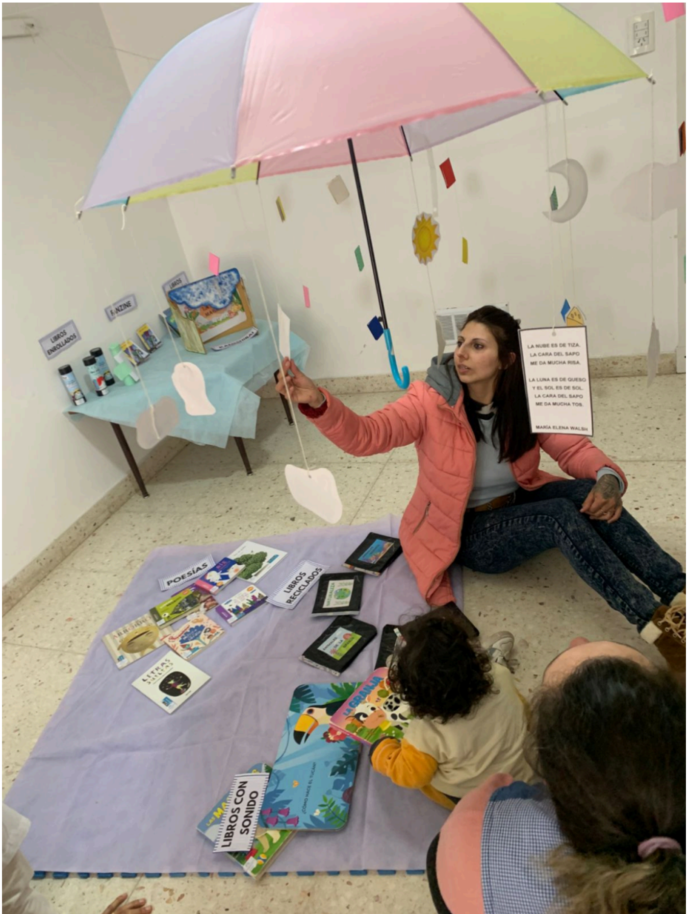
Escuela de Educación Temprana N° 1, Balcarce.