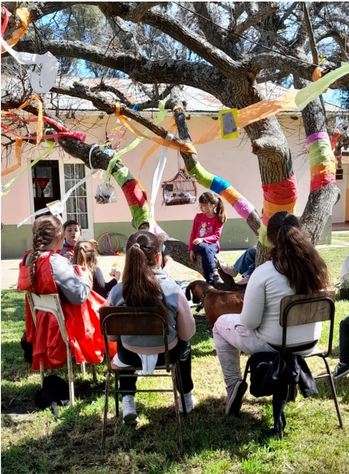
Escuela Primaria N° 4, Gral. Belgrano.