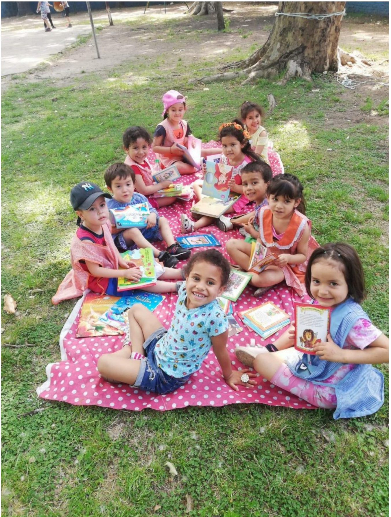
Centro Educativo Complementario N° 1, Lomas De Zamora.