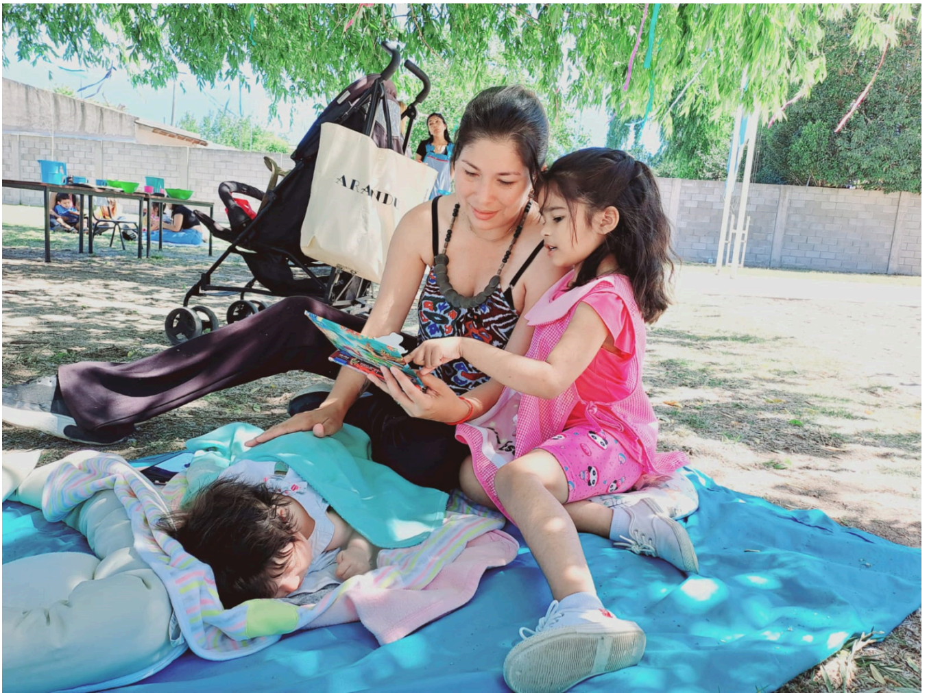
Jardín de Infantes N° 936, Almirante Brown.