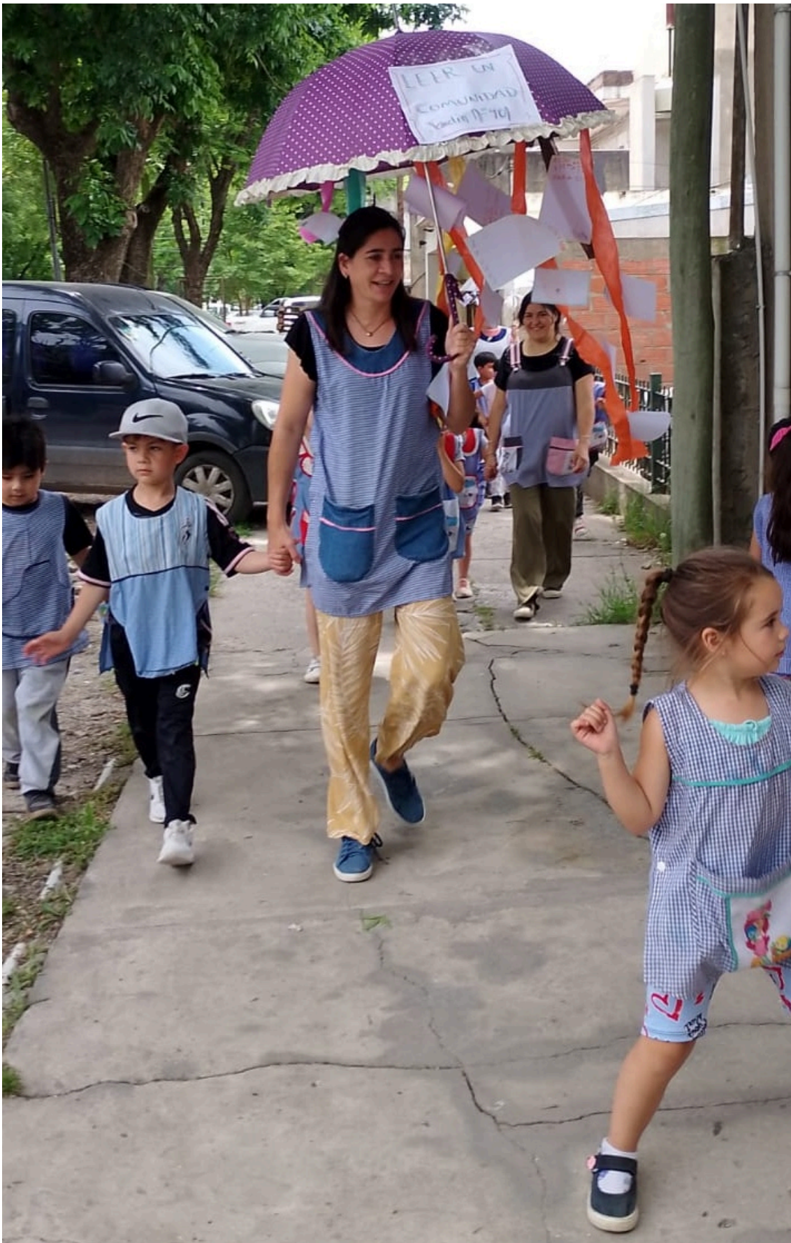
Jardín de Infantes N° 901, Punta Indio.