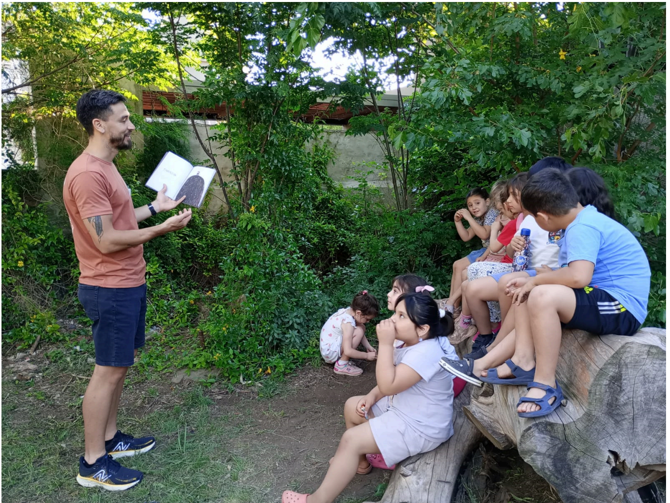
Escuela de Educación Estética N° 1, Pergamino.

Realizar una feria del libro en la escuela. Cada institución elegirá qué modalidad puede desarrollar: intercambios de libros, invitaciones a representantes de editoriales o armado de puestos con libros de la biblioteca institucional. En este último caso, la disponibilidad de obras puede definirse según intereses temáticos o de géneros, distribuidos en un sector amplio de la escuela y con estudiantes que oficien de promotoras y promotores.