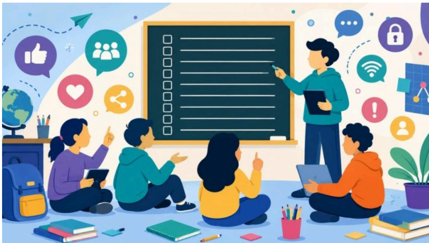
Imagen de portada: Imagen generada con ChatGPT

Autoría: Dirección de Tecnología Educativa, Subsecretaría de Educación, DGCyE.