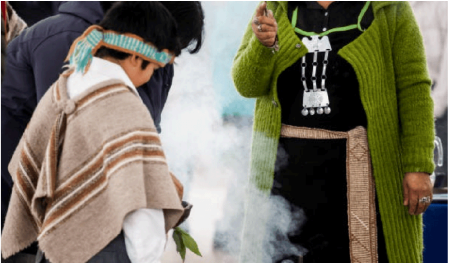
Imagen de portada: Archivo DGCyE

Autoría: Dirección de Ámbitos de Desarrollo de la Educación, Subsecretaría de Educación, DGCyE