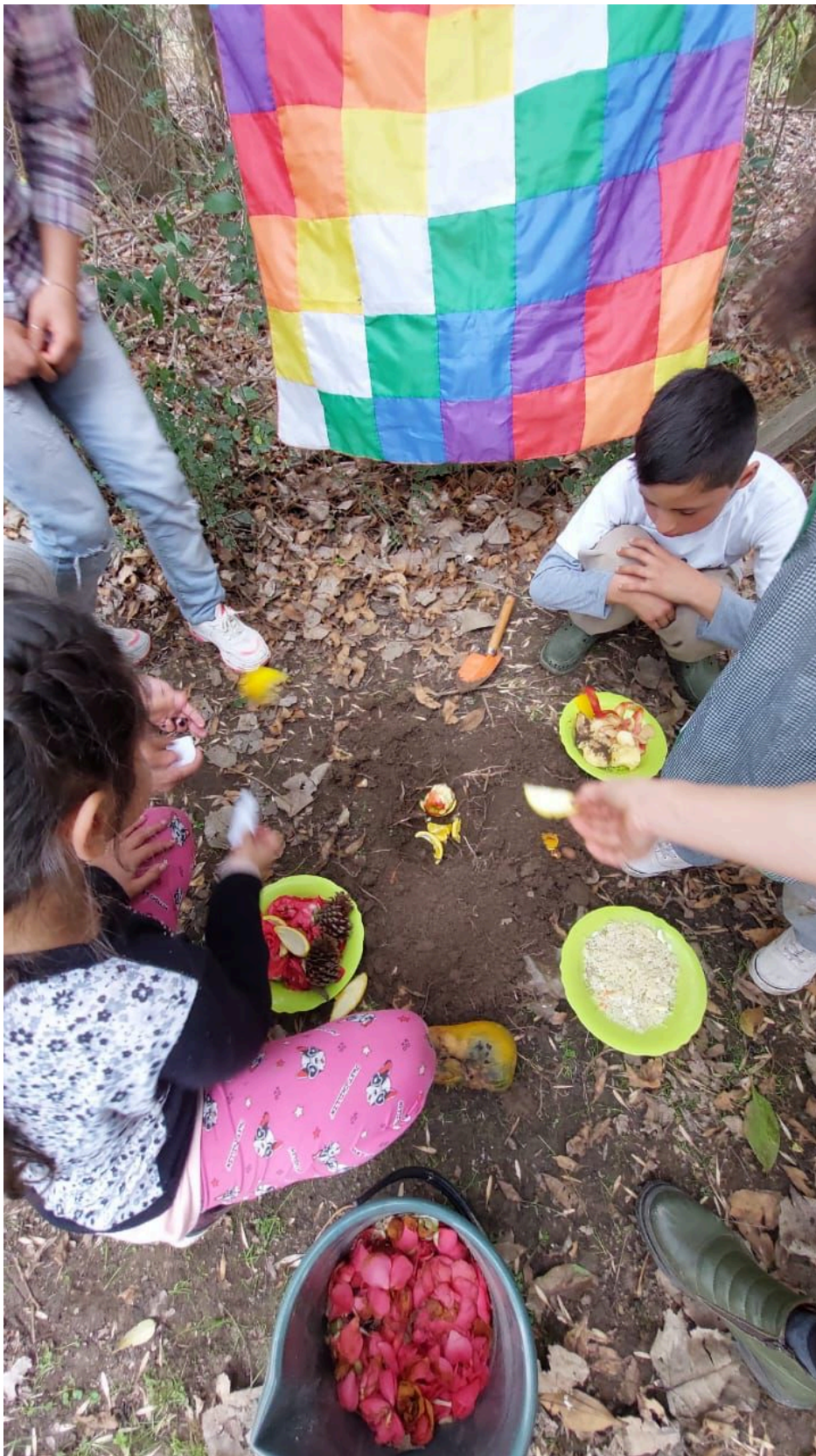
Escuela Primaria N° 25, Arroyo Caracoles, Tigre, provincia de Buenos Aires.