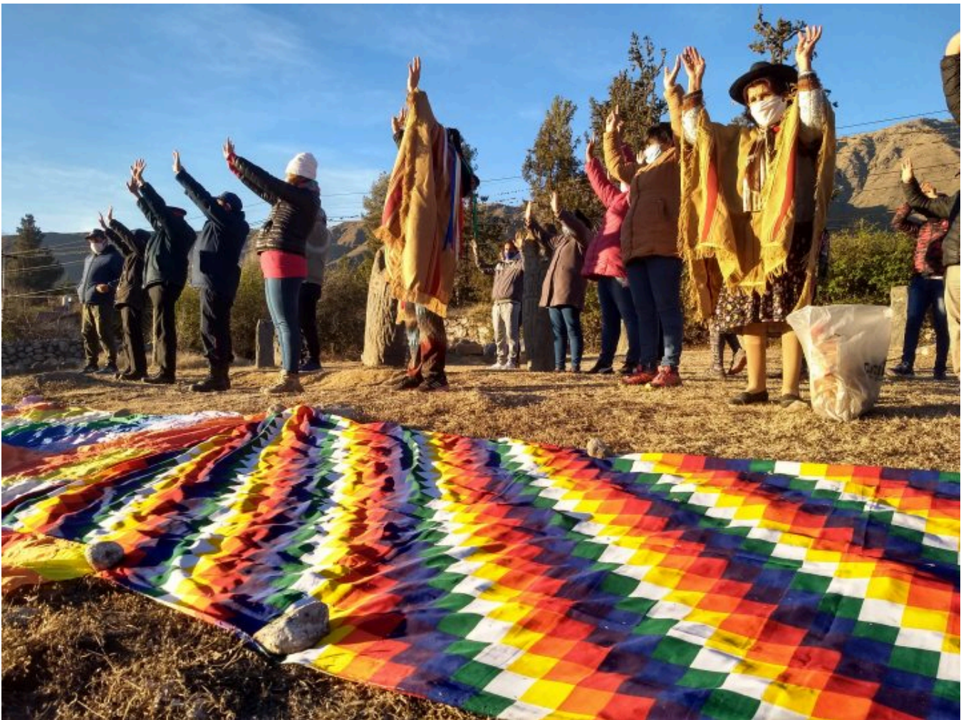
Celebración del Inti Raymi en el Museo Arqueológico a Cielo Abierto Menhires del Tafi, Tucumán.

El reconocimiento del Año Nuevo de los Pueblos Originarios responde a una larga genealogía de luchas jurídicas y políticas por los derechos humanos de los pueblos preexistentes.