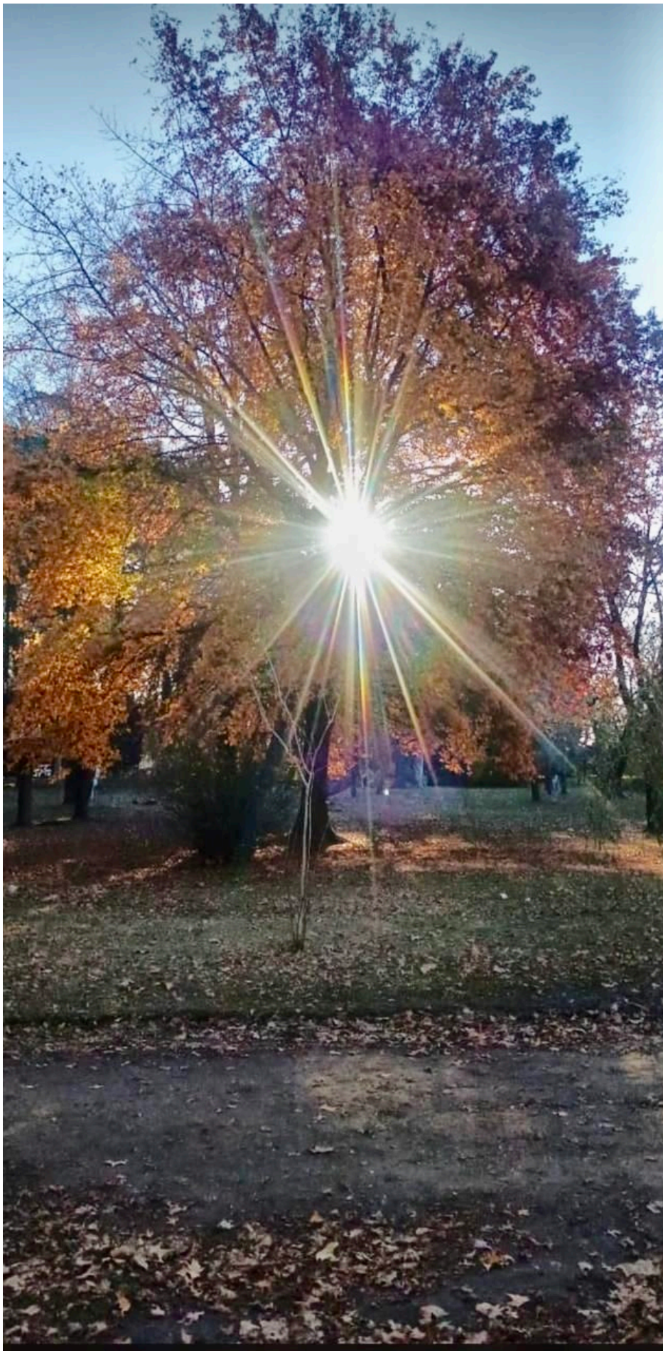
El camino hacia la entrada a una escuela primaria de modalidad rural, provincia de Buenos Aires.