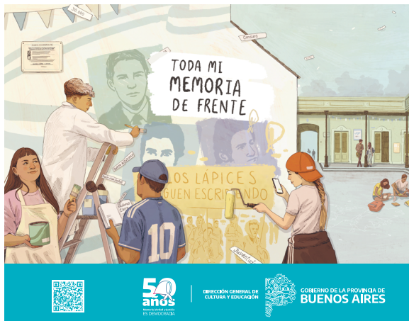
Afiche Nivel Secundario