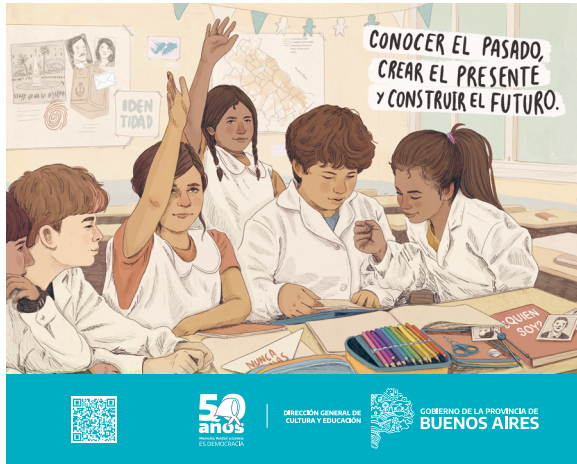
Afiche Nivel Primario