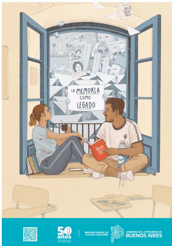
Afiche Nivel Superior

Ilustraciones de Aymarará Mont.