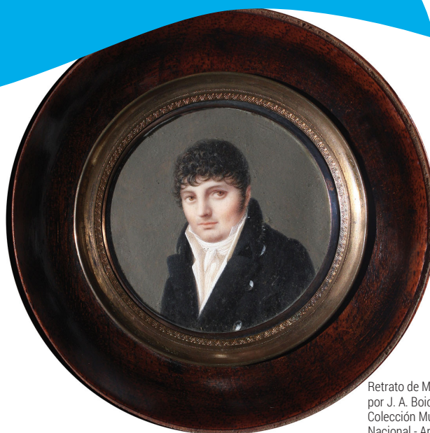
Retrato de Manuel Belgrano por J. A. Boichard, 1793. Colección Museo Histórico Nacional - Argentina.